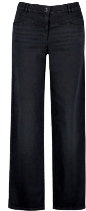
PULLOVER 571541 26438 5700 / 62 % CV, 33 % PA, 5 % EL TROUSERS 520526 21170 1100 / 81 % CO, 17 % PES, 2 % EL