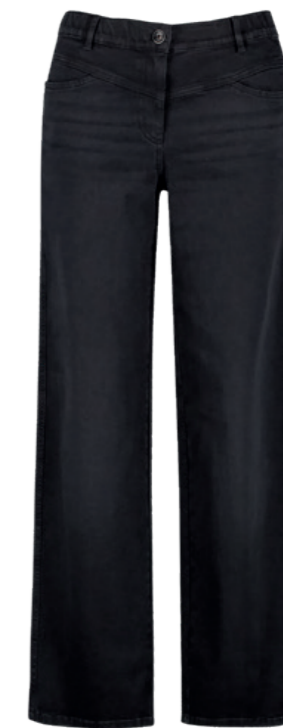
PULLOVER 571541 26438 5700 / 62 % CV, 33 % PA, 5 % EL / 89,99 € TROUSERS 520526 21170 1100 / 81 % CO, 17 % PES, 2 % EL / 109,99 €